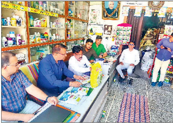
भिवानी। दुकान पर बीज की जांच करते अधिकारी।

कृषि विभाग ने नकली बीज व दवाई बेचने वाले विक्रेताओं पर नकल कसने के लिए कृषि विभाग ने कमर कस ली है। मुख्यालय से मिले टारगेट के बाद कृषि विभाग द्वारा बीजों के सैपल लेने के लिए 4 टीमों का गठन किया गया है, जिसके बाद अब ग्रामीण व शहरी क्षेत्र में स्थित खाद, दवाई व बीज विक्रेताओं की दुकानों पर छापेमारी अभियान चलाया जाएगा। इसी क्रम में कृषि विभाग की टीम ने बीज