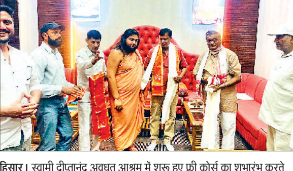
हिसार। स्वामी दीपानंद अवधूत आश्रम में शुरू हुए फ्री कोर्स का शुभारंभ करते संत व अन्य लोग।

युवाओं को रोजगार की दिशा में अग्रसर करने के उद्देश्य से खरड़ अलीपुर में होटल मैनेजमेंट का निशुल्क कोर्स शुरू किया गया है। भारत सरकार के उपक्रम पर्यटन मंत्रालय द्वारा चलाए जा रहे कोशल सेंटर द्वारा खरड़ अलीपुर के स्वामी दीपानंद अवधूत आश्रम में यह कोर्स तीन महीने तक करवाया जाएगा। हुनर से रोजगार तक के नाम से संचालित किए जा रहे इस कोर्स के दौरान 300 विद्यार्थियों के लिए आवास व भोजन की व्यवस्था भी निशुल्क रहेगी। इस कोर्स को