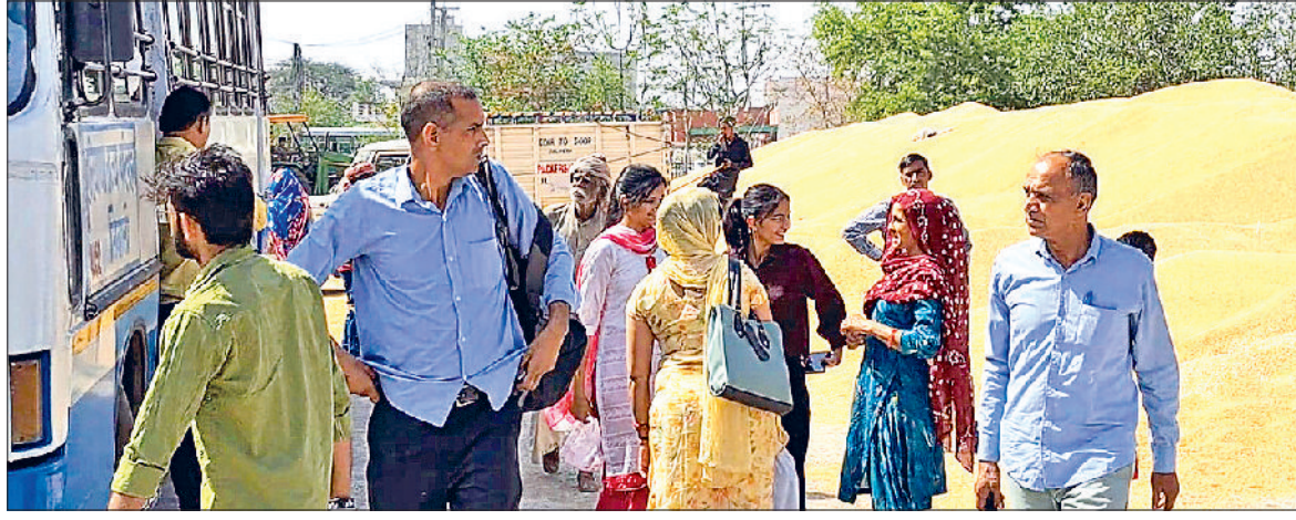
भिवानी। बाढ़ड़ा बस स्टैंड परिसर में लगी गेहूं की ढेरियां व बस से उतरते यात्री।

प्रशासन ने बाढ़ड़ा बस स्टैंड को वैकल्पिक अनाजमंडी में तब्दील कर गेहूं डलवाना शुरू कर दिया।