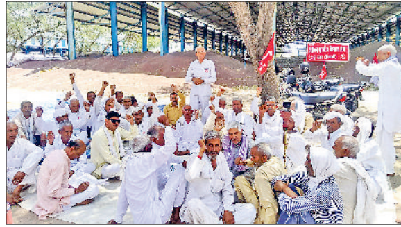
बहल। बहल अनाजमंडी में धरने पर बैठे किसान।