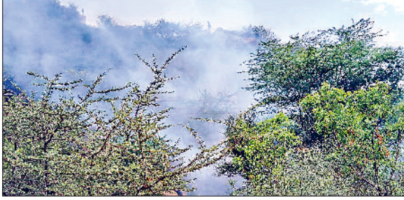
लोहारू। लोहारू के पहाड़ी गांव में पहाड़ी माता मंदिर के पीछे खुले क्षेत्र में आग लगने से उठते धुएं का गुब्बारा।