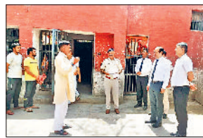
भिवानी। जेल में बंदियों से बातचीत करते हुए।