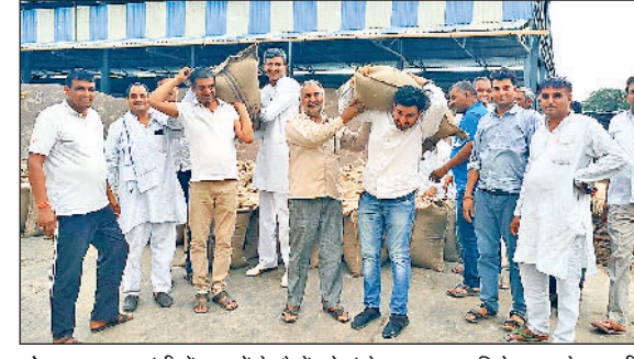
तोशाम। अनाजमंडी में सरसों के बैगों को कंधे पर उठाकर विरोध जताते आदती।

खरीद के लिए सरसों वेयरहाउस कापारेशन द्वारा खरीदी जानी है, परंतु बहुत कम मात्रा में सरसों खरीद रहा है, जिसके कारण 1.25 किंवटल से अधिक सरसों बिना खरीद मंडी में पड़ी है।