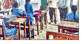
चरखी दादरी। डी.एस.ओ. का निरीक्षण।