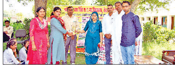
चरखी दादरी। ग्राम सभा में उपस्थित बच्चे व ग्रामीण।

अभियान में स्कूलों और ड्राइविंग संस्थानों में ड्राइवर्स को यातायात नियमों और सुरक्षा संबंधित नियमों के प्रति जागरूक नैतिक करेंगे। वहीं उन्हानी गांव उन्हानी में स्कूल बस के हादसे पर गहरी संवेदना व्यक्त करते हुए कहा कि पूरे हरियाणा प्रदेश के लिए ये बेहद दुख की घड़ी है। इस दर्दनाक हादसे में जान गंवाने वाले